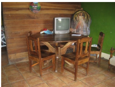
Essenstisch mit Fernseher

Die Kurzversion: Mit meiner Gastfamilie gabs einige Verwerfungen, weil sich die Gasteltern getrennt haben und die Gastmutter mich dann unbedingt in ihren Sorgerechtsstreit/Trennungsstreit mit dem Vater mit rein ziehen musste. Bei einer für sie elementaren Sache (der Gastvater hatte uns seine Gitarre geliehen, sie wollte sie aus meinem Zimmer nehmen und verkaufen) habe ich ihr dann Paroli geboten, woraufhin ich die letzten 2 Wochen dann sozial isoliert in der Familie verbringen durfte. Früher ausziehen hätte ich auch gekonnt, allerdings hätte ich dann das Restgeld verloren, das wollten sie mir nicht zurück geben.