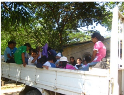
29 Jugendliche mit einem LKW? Kein Problem!

Im großen und ganzen ging das Zeltlager darum, Kindern zwischen 10 und 18 Jahren zu erklären, was sexueller Missbrauch ist, dass das nicht erlaubt ist und was man dagegen machen kann.