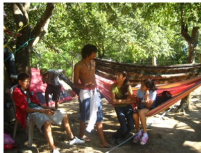
Nachtlager: Hängematten und Zelte