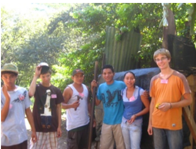
Meine Gruppe mit mir als Betreuer Im Hintergrund unsere gerade fertig gestellte Dutschkabine

Am Abend des ersten Tages sollten alle Gruppen übrigens auch noch irgendetwas vorführen. Da in meiner Gruppe fast nur Ältere zu finden waren, griff ich den Vorschlag auf, doch eine Art „Sketch“ vorzuführen. Ich habe das ganze dann etwas in Eigenregie hin zu einem kleinen Improtheater geführt, was für die anderen etwas sehr Neues darstellte. Nachdem ich dann ein paar Redebeiträge nach dem Motto „so, jetzt sprechen wir Wort für Wort durch was wir gleich sagen“ 5 Minuten vor Vorführung beiseite gebügelt hatte, waren wir dem Begriff Improtheater sogar schon sehr nah gekommen.