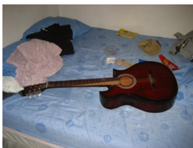
Das Objekt der Begierde: die Gitarre