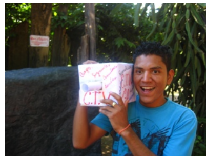
CTV: Unser Campfernsehsender (bei dem man jedoch daneben stehen musste um etwas mitzu- bekommen)