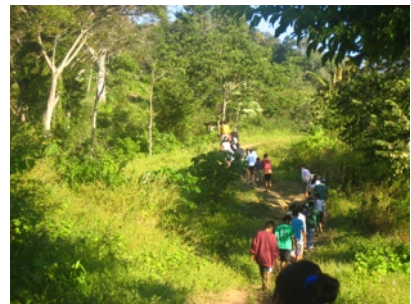
Auf dem Weg zum Wasserfall